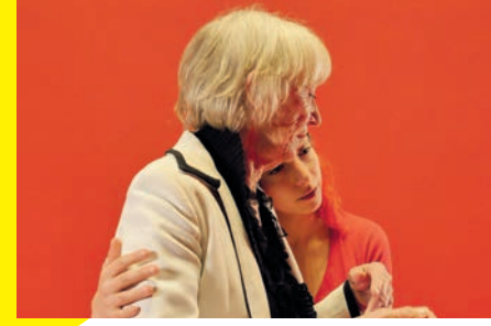
© Rosalie Lust & Salomé Laloux-Bard

À travers le temps qui passe, la pièce raconte les rêves et désirs de cinq femmes, comment ceux-ci les submergent, les tiennent en éveil et les poussent à un dépassement. Puisant dans le vécu des interprètes - de 25 à 82 ans - chaque saison met à l'honneur le point de vue d'une génération. Pour dire la beauté du corps qui change et traverser le temps comme un apprentissage de nos propres métamorphoses. Rouge [Automne, Hiver] est la première partie de Rouge [les quatre saisons] .